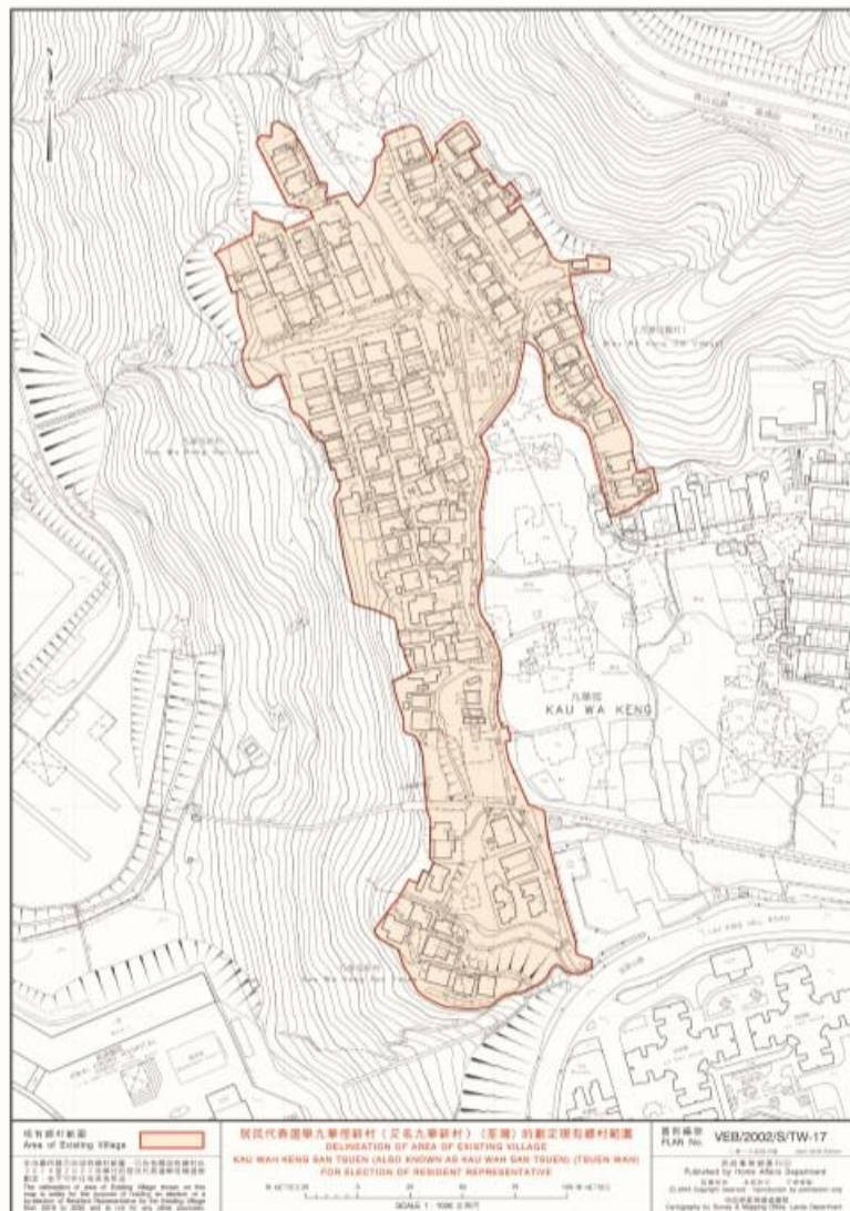
地圖二：居民代表選舉九華徑新村又名（九華新村）（荃灣）的劃定現有鄉村範圍