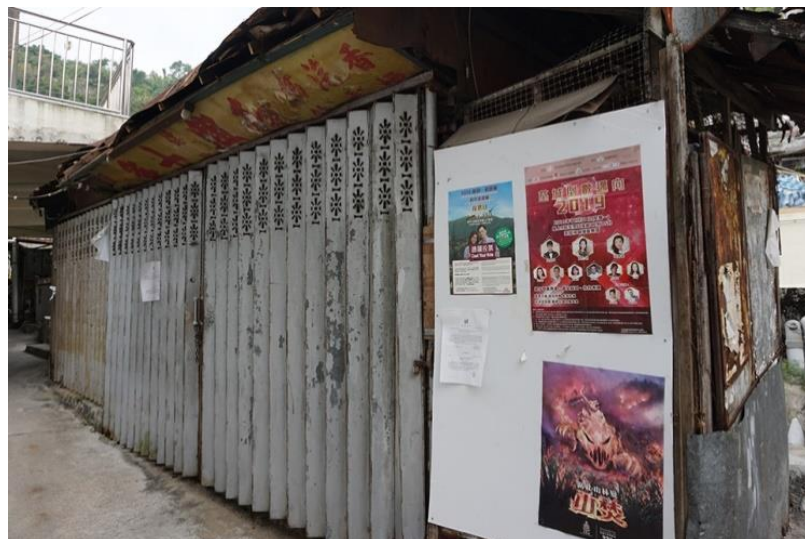
圖九：因被視為違規僭建物，而等待清拆的和興士多