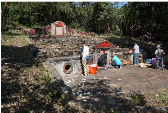
圖十三：九華徑舊村祖墳

九華徑舊村的祖墳位於海峰花園附近的小山丘，鄰近長坑村。每年秋祭時，九華徑舊村村長及村代表皆會先聘請農林護理公司於秋祭前到祖墳除草。秋祭當天，村民在墓前放置祭品，通常為燒肉、熟雞及水果等。拜祭儀式完畢後，男丁負責焚紙錠、化元寶。祭祀儀式完畢，將分吃祭品。隨着時代變遷，食山頭儀式已從簡，此外，亦改在村公所以食盤菜，俗稱「食山頭」的習俗仍然保存至今，只是地點改變而已。